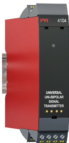
Рисунок 3 - Общий вид преобразователей измерительных серии PR модификаций 4104, 4114, 4116,