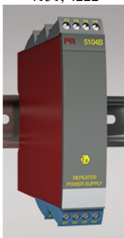
Рисунок 5 - Общий вид преобразователей измерительных серии PR модификаций 5104, 5105, 5106, 5107, 5114, 5115, 5131, 5116, 5223