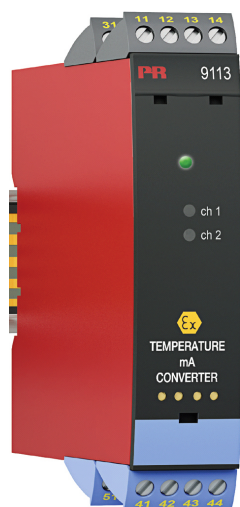
Рисунок 9 - Общий вид преобразователей измерительных серии PR модификаций 9106, 9107, 9113, 9116