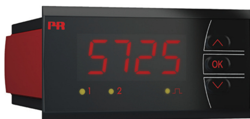
Рисунок 7 - Общий вид преобразователей измерительных серии PR модификаций 5531, 5714, 5715, 5725