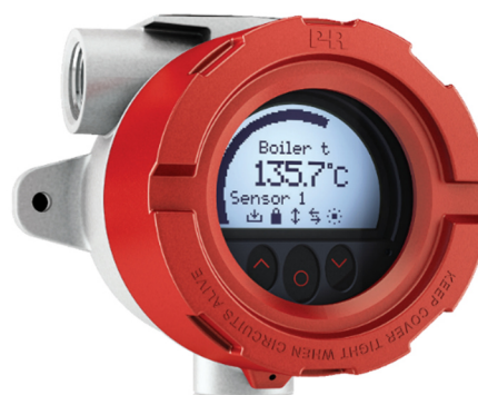
Рисунок 8 - Общий вид полевого преобразователя серии PR модификации 7501 (выпускается в 2 цветах: красный и синий)