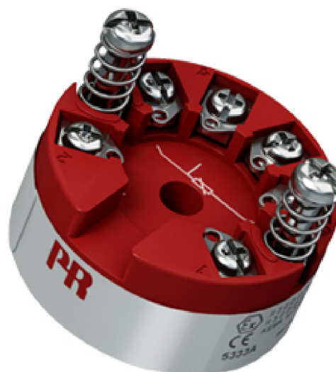
Рисунок 4 - Общий вид преобразователей измерительных серии PR модификаций 5331, 5333, 5334, 5335, 5337, 5343, 5350