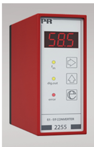
Рисунок 1 - Общий вид преобразователей измерительных серии PR модификаций 2224, 2231, 2255, 2261, 2286, 2289

Фотографии общего вида преобразователей приведены на рисунках 1-11.