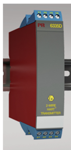
Рисунок 6 - Общий вид преобразователей измерительных серии PR модификаций 6331, 6333, 6334, 6335, 6337, 6350, 6437