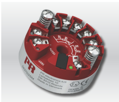
Рисунок 11 - Общий вид преобразователя измерительного серии PR модификации 5437

Пломбирование преобразователей измерительных PR не предусмотрено. Знак поверки на корпус преобразователя не наносится. Заводской номер наносится на корпус преобразователя в числовом формате. Общий вид преобразователей измерительных серии PR с указанием мест нанесения заводского номера приведен на рисунке 12.